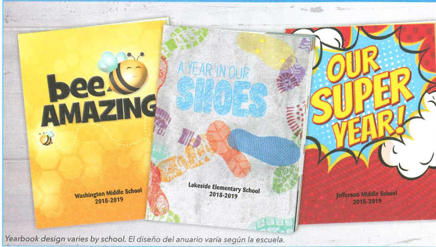
Yearbook design varies by school. El diseño del anuario varía según la escuela.